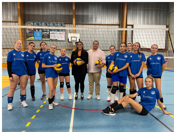
Le restaurant « Les Petites Bretonnes » est présent sur le maillot offert à chaque licencié cette saison