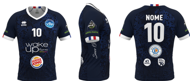
Maillot N2M saison 2023-2024

En échange de votre soutien, vous bénéficiez de :