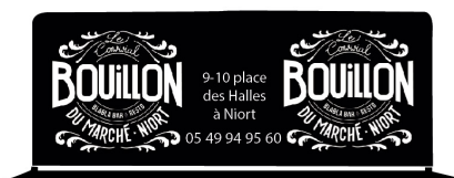
Panneaux recto/verso affichés dans le gymnase (2mx1m)